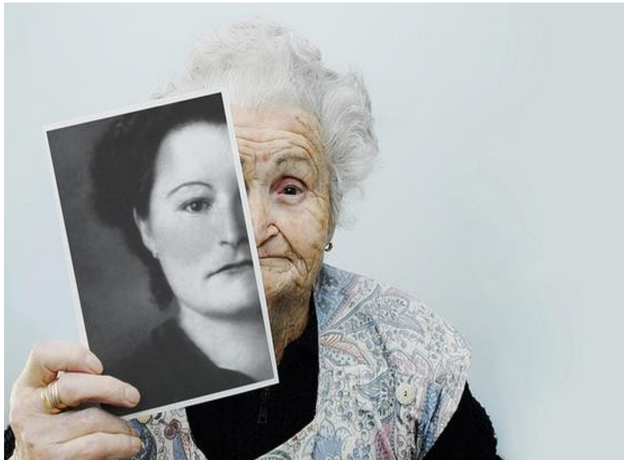
IMAGEN DINAMICA INCONSCIENTE DEL CUERPO