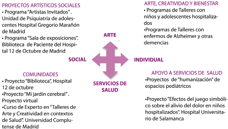
Fig. 3. Acciones proyecto curarte I+D, siguiendo la estructura del Diamante del Arte y la Salud propuesta por McNaughton et al. (2005)

Desde el proyecto curarte I+D, continuando con el esquema propuesto por McNaughton, se han desarrollado varias acciones que ilustran las relaciones que el Arte y la Salud potencialmente pueden establecer: