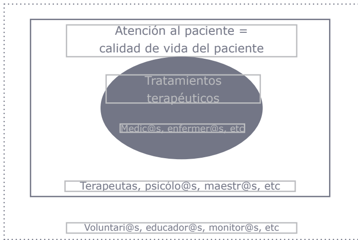
Fig. 2. Diagrama del posicionamiento del Educador Artístico en Contextos de Salud.

perfectamente legitimada. Pero estos profesionales no pueden cubrir todas las necesidades y por encima de esta capa podemos ver otras más diluidas que la conforman los voluntarios, familiares, monitores, etc. Uno de los objetivos de la implementación de talleres artísticos en espacios sanitarios es pasar a formar parte de la primera capa concéntrica, reconociendo la labor de la educación artística en el ámbito de la salud.