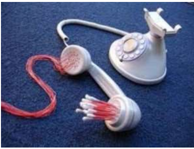
Figura 7. Asepsiófono , de Adán Vallecillo. [Fotografía de Adán Vallecillo]. (Tegucigalpa, 2005). Archivos fotográficos del autor.

8. Perdidos, pero tomados de la mano (Figura 8), es una obra de mi autoría que representa esa condición de estar en el mundo, quizás sin la certeza de saber cuál es la verdad o el destino pero estando unidos. Esa unidad en medio de la tragedia proviene del conocimiento procomún, algo que puede lograrse a través del arte y la cultura.