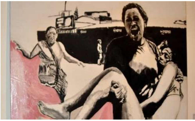
Figura 4. Honduras Bajo el Suelo , de Federico Rosa Suazo. (Museo de la Identidad Nacional, Tegucigalpa, 2017).

5. Jorge Ouelí emplea su cuerpo como objeto y sujeto en su performance Honduras. Alegoría de un país que no pudo ser (Figura 5), atónita estampa de la espera, en espera de algo que no existe.