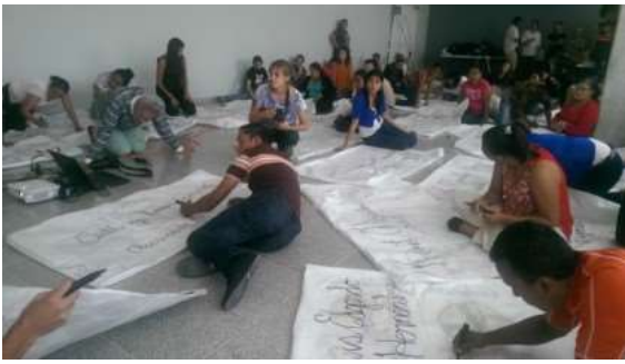
Figura 10. En pleno proceso MAE de la obra de Oqueli. [Fotografía de Lidia Cálix]. (Palacio de los Deportes, UNAH. 2015). Archivos fotográficos propios.