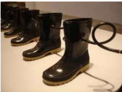
Figura 6. Autopoiesis I , de Adán Vallecillo. (Museo para la Identidad Nacional, Tegucigalpa, 2008).

6. En Autopoiesis I (Figura 6), Adán Vallecillo discursa sobre los dispositivos tecnológicos y culturales que aceleran el crecimiento de los niños, sometiendo sus cuerpos y espíritus a situaciones de explotación y que los priva de un desarrollo físico, psíquico y emocional saludable.