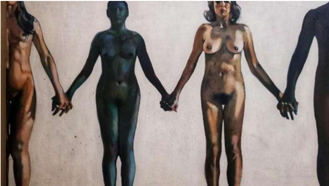
Figura 8. Perdidos pero tomados de la mano , de Lidia Cálix. [Fotografía de Lidia Cálix] ]. (Tegucigalpa, 2005). Archivos fotográficos propios.

8. Perdidos, pero tomados de la mano (Figura 8), es una obra de mi autoría que representa esa condición de estar en el mundo, quizás sin la certeza de saber cuál es la verdad o el destino pero estando unidos. Esa unidad en medio de la tragedia proviene del conocimiento procomún, algo que puede lograrse a través del arte y la cultura.