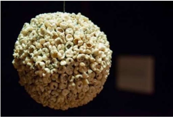
Figura 2. Alboroto , de Adán Vallecillo. (Museo para la Identidad Nacional, Tegucigalpa, 2015).

2. El artista visual Adán Vallecillo, con su obra conceptual Alboroto (Figura 2), refiere al popular dulce de maíz y panela, a través de un símil que construye con dientes con caries, recolectados de distintas zonas del país, aludiendo a la precariedad, la miseria y a las propias deudas sin saldar.