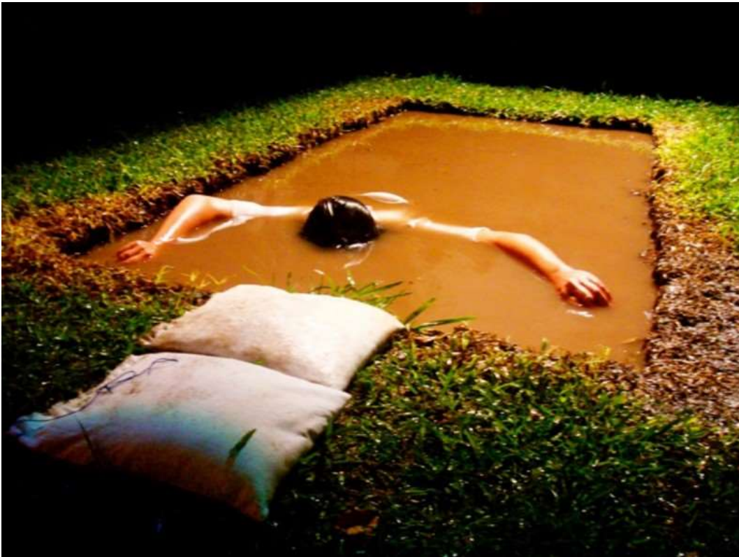
Figura 5. Alegoría de un país que no pudo ser , de Jorge Ouelí. (Galería Nacional de Arte, Tegucigalpa, 2010). De la colección de la III bienal de Honduras.

5. Jorge Ouelí emplea su cuerpo como objeto y sujeto en su performance Honduras. Alegoría de un país que no pudo ser (Figura 5), atónita estampa de la espera, en espera de algo que no existe.