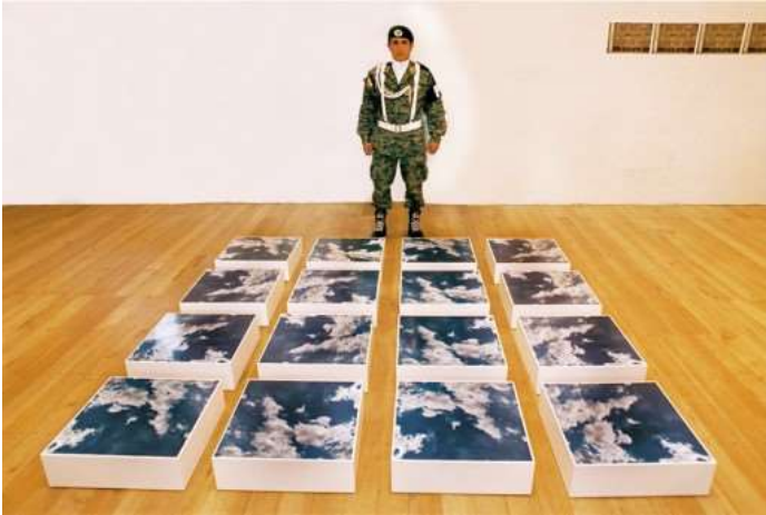
Figura 1. Nubes para ser resguardadas , de Gabriel Galeano. [Fotografía de Gabriel Galeano]. (Mujeres Unidas en las Artes, Honduras 2009). Archivos fotográficos del autor.

1. Años atrás del doloroso asesinato de Berta Cáceres, el artista visual Gabriel Galeano presentó su obra Nubes para ser resguardadas (Figura 1). Una pieza conceptual que discursa sobre la paradoja del agua, un recurso vital que debería ser de acceso para todos, pero que es resguardado en tanto mercancía, generando desigualdad social.