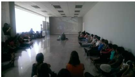
Figura 9. Iniciando las MAE a partir de la obra de Oqueli. (Palacio de los Deportes, UNAH. 2015).