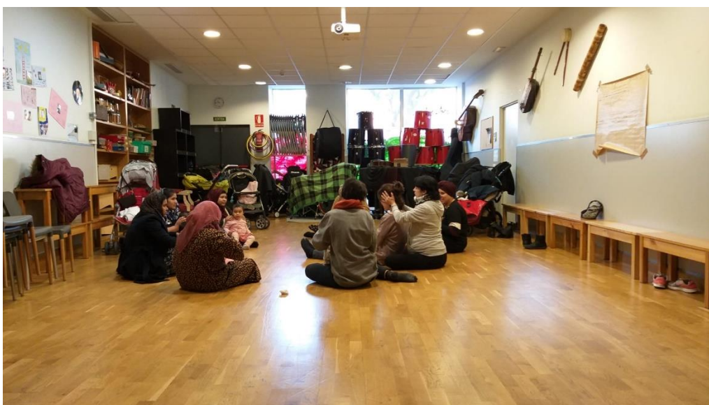
Imagen 12, Actividad con Madres y Bebés de Conciencia Corporal realizada el 11/12/2019, Segundo Grupo. Autora Lina Botero. (Ver Anexos).