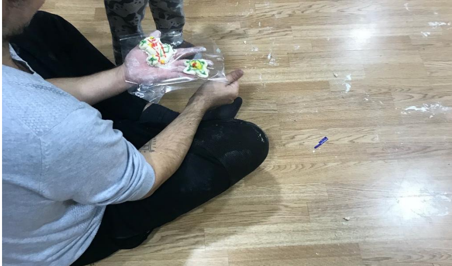
Imagen 5, Creación Simbólica Harina Familias y Niños/as realizada el 12/12/2019. Autora Lina Botero. (Ver Anexos).