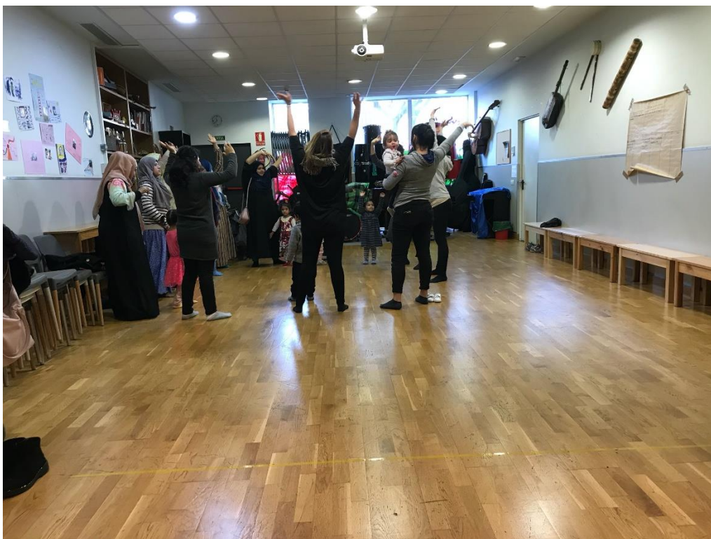
Imagen 11, Actividad con Madres y Bebés de Conciencia Corporal realizada el 11/12/2019, Segundo Grupo. Autora Lina Botero. (Ver Anexos).