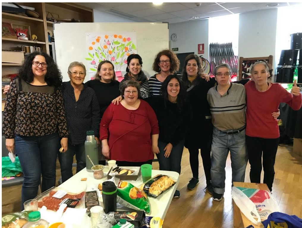
Imagen 16, Árbol de Oportunidades Actividad Mujeres Coro realizada el 19/12/2019. Autora Lina Botero. (Ver en Anexos).

Contamos con una integrante nueva que venía a probar como eran las clases y otra dejó de asistir, volvimos a repasar las partes del árbol una mujer me preguntó si lo podría realizar con su hija adolescente puesto que estaba teniendo muchos problemas con ella.