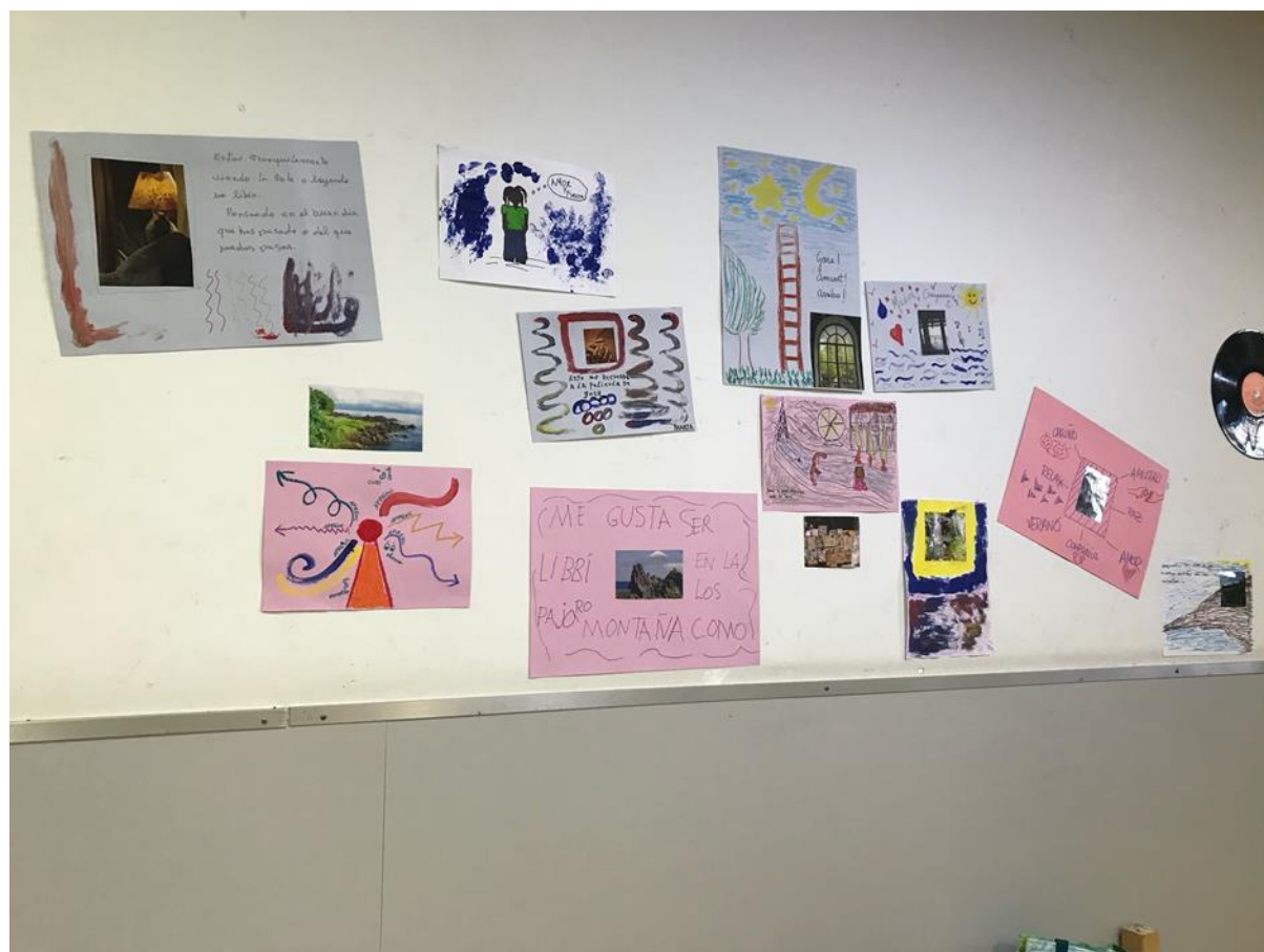
Imagen 4, Exposición Actividad; Creación Simbólica noviembre 28 del 2019 Coro Mujeres. Autora Lina Botero. (Ver Anexos).

que no se hace de manera clínica, esta es ver qué impresión nos genera desde la explicación del autor, los/las autoras, se deja la autoevaluación a la persona que lo explica y lo describe (quien lo realizó), no se juzga, se critica ni se evalúa externamente, evitar las justificaciones y dar por hecho lo observado o lo narrado. Moreno (2019).