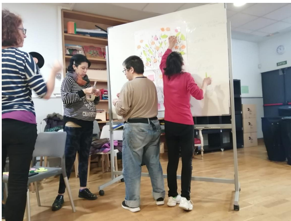
Imagen 15, Árbol de Oportunidades Actividad Mujeres Coro realizada el 19/12/2019. Autora Lina Botero. (Ver Anexos).

A muchas se les dificultó ver cuáles eran sus fortalezas dentro del coro, y entre el grupo se iban guiando, con ejemplos.