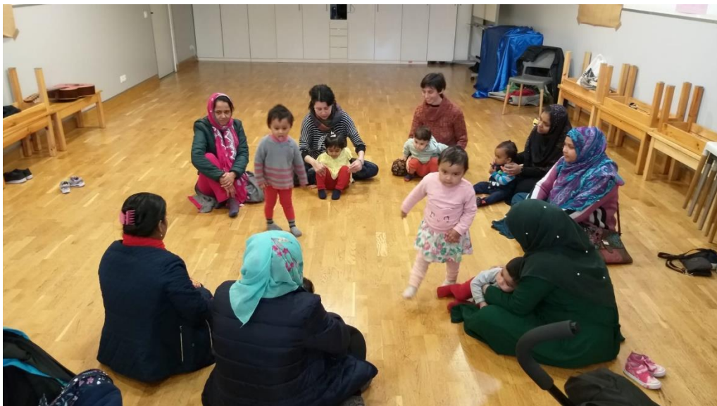
Imagen 9, Actividad con Madres y Bebés de Conciencia Corporal realizada el 11/12/2019. Autora Lina Botero. (Ver Anexos).

No sentamos y hacemos unos pequeños ejercicios de respiración (algunas no los hacen) y luego ejercicios de afecto con sus hijos/as la canción de "La Formiga", con los bebés sentados se les hace masajes en los brazos, la cabeza, las piernas, el estómago en sentido de manecillas del reloj (algunos bebés se dejan tocar otros no), al momento que cogía una bebé con el permiso de la madre para que fuera la modelo y se pudieran guiar cómo hacerles los masajes, se quitaba y no se dejaba realizar los masajes, la docente de la clase me dijo que hiciera la demostración con ella.