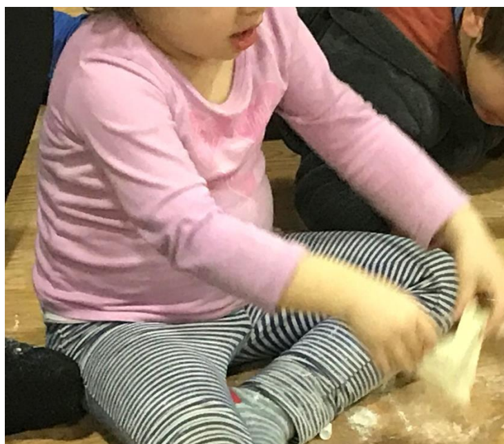
Imagen 8, Creación Simbólica Harina Familias y Niños/as realizada el 12/12/2019. Autora Lina Botero. (Ver Anexos).