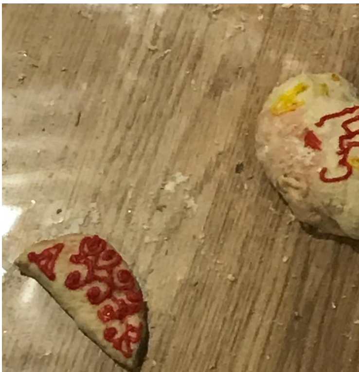
Imagen 7, Creación Simbólica Harina Familias y Niños/as realizada el 12/12/2019. Autora Lina Botero. (Ver Anexos).