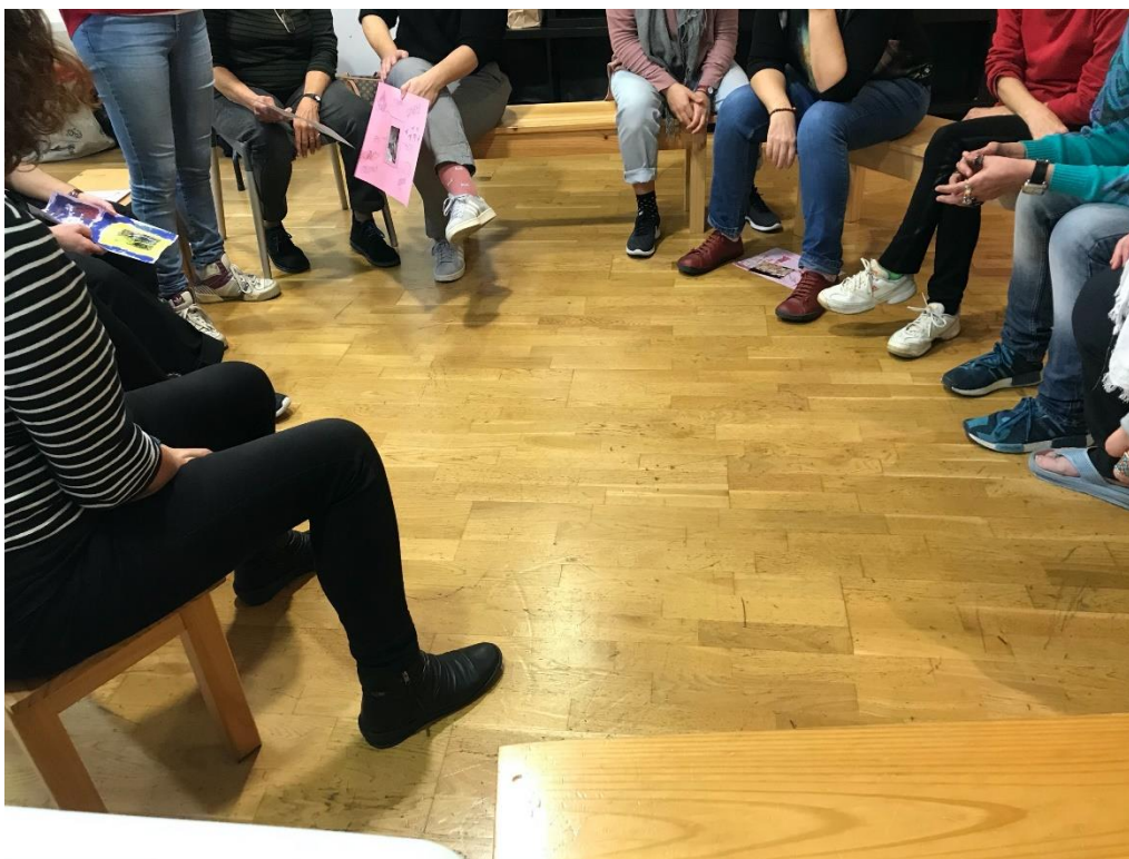
Imagen 14, Creación Simbólica Mujeres Coro, realizada el 28/11/2019. Autora Lina Botero. (Ver en Anexos).

Cuando se realizó la puesta en común, se abrió con la actividad pasada en la cual se cantó, un evento de feminismo y se ancló con lo que habían sentido y les había quedado de ese espacio en la presentación de lo que habían hecho. Se paso un pañuelo para poder mediar los comentarios y dar mayor organización al respecto. Muchas no quisieron halar al respecto del dibujo realizado, pero estuvieron de acuerdo que se expusieran en el aula.