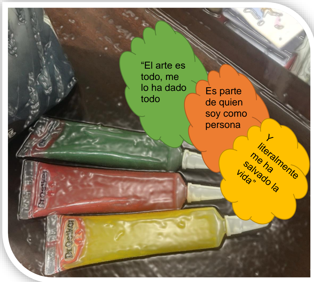
Imagen 1, Actividad de Creación Simbólica en Masa de Harina con Familias y sus hijos, realizado el 12/12/2019. Autora Lina Botero. Frase recopilada de una entrevista a una alumna de Xamfrá, el 24/12/2019, (Ver Anexos).