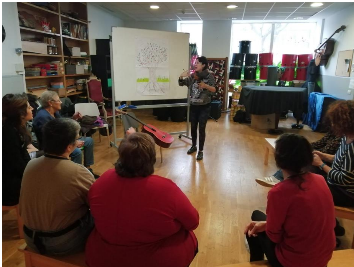
Imagen 2, Actividad Árbol de Oportunidades; Coro Mujeres, 19 de diciembre de 2019. Autora Lina Botero. (Ver Anexos).